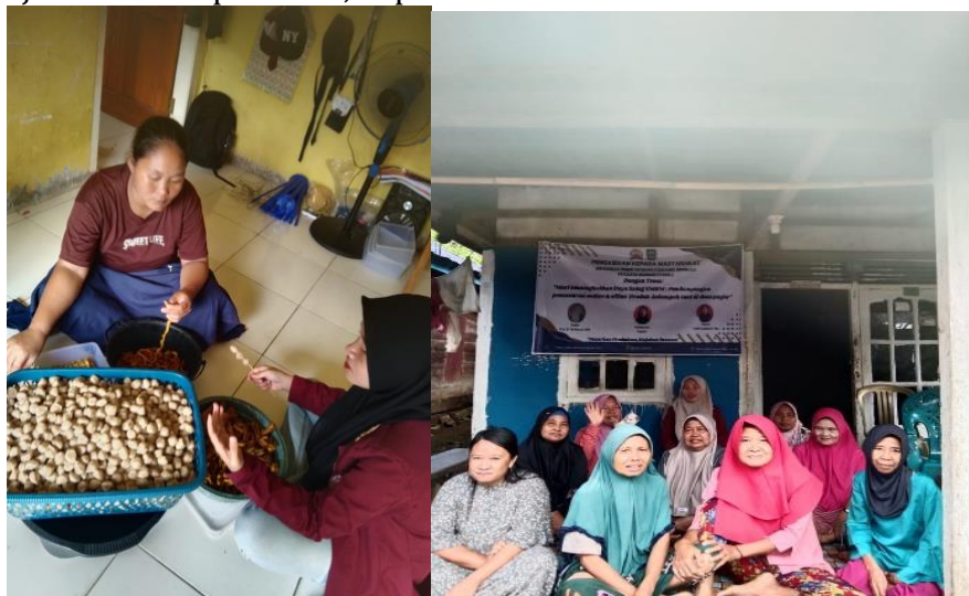
Gambar 3. Evaluasi

Evaluasi merupakan langkah yang sangat penting dalam melaksanakan program pengabdian ini. Evaluasi ini bertujuan untuk menilai dan mengukur tingkat keberhasilan program yang telah dilaksanakan. Evaluasi ini dilakukan bersama dengan Kelompok Tani, Sepakat Tani Desa Pagar Kecamatan ulu talo, kemudian dapat disimpulkan bahwa dengan adanya program kerja yang telah dilaksanakan berupa penyampaian materi tentang pemasaran produk UMKM Penyusunan laporan merupakan tahapan terakhir dalam program pengabdian ini, dengan adanya laporan ini diharapkan dapat menjadi acuan kepada pemangku kepentingan dan instansi untuk dapat terus memajukan Kelompok Tani, Sepakat Tani.