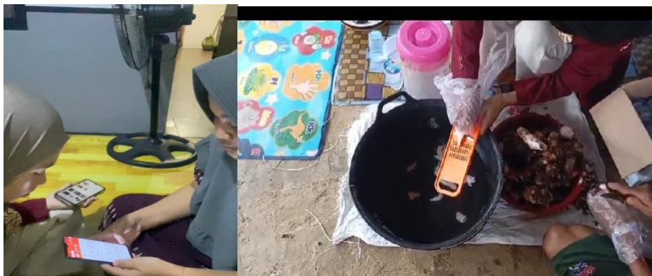
Gambar 2. Kegiatan Pembinaan kelompok tani

Pelaksanaan kegiatan mengacu pada rencana yang telah dirancang dan tertuang pada jadwal pelaksanaan pengabdian masyarakat. Pendampingan program pemasaran produk UMKM Kelompok Tani, Sepakat Tani terletak didesa Pagar. Dimana pendampingan ini dilaksanakan untuk memberi pemahaman tentang pemasaran produk UMKM pada pengurus Kelompok Tani, Sepakat Tani Desa Pagar Kecamatan ulu talo. Kegiatan Ini dilaksanakan pada Tanggal 5 agustus 2025 sampai dengan 1 oktober 2025.