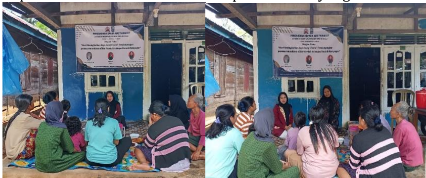
Gambar 2: Kegiatan Observasi

Pada tahapan ini, dilakukan observasi dengan mengunjungi lokasi pengabdian, bertema dengan Ketua Kelompok Tani, Sepakat Tani Pada kesempatan ini Ketua Kelompok Tani memintak pelaksanan tugas pengabdian masyarakat dilakukan di Desa Pagar dikarenakan Kelompok Tani dari Desa Pagar berbadan hukum. Salah satu aspek penting dalam pengabdian ini adalah komunikasi dan kordinasi dengan pihak terkait seperti kepada Ketua Kelompok dan Desa sasaran. Dengan adanya kordinasi yang baik kepada semua pihak terkait maka akan mendapatkan hasil yang maksimal.