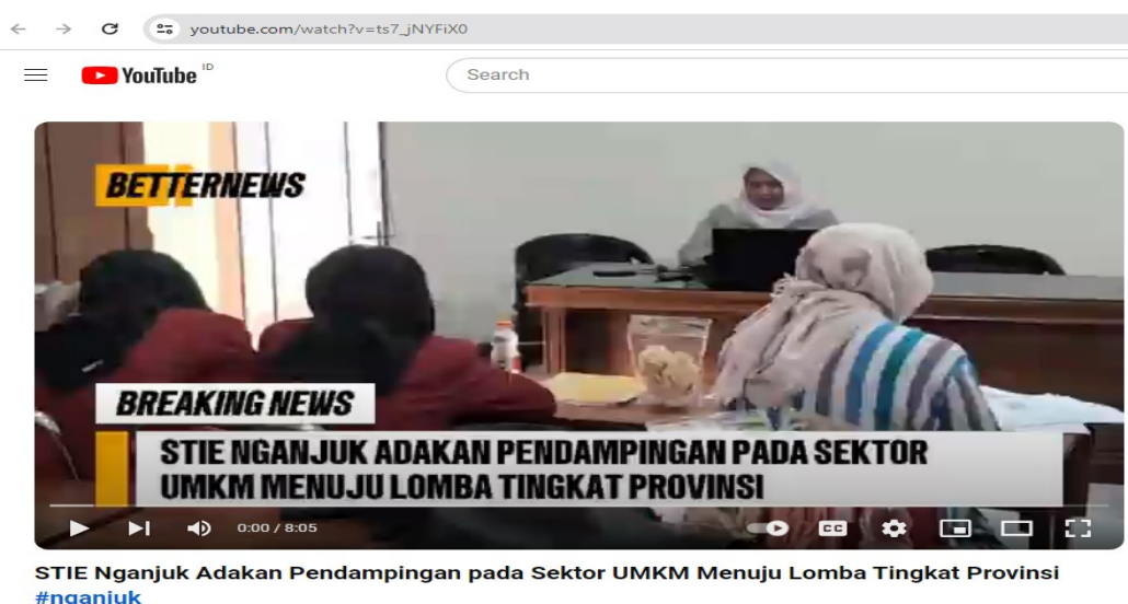
Gambar 3. Video Program Pengabdian Masyarakat