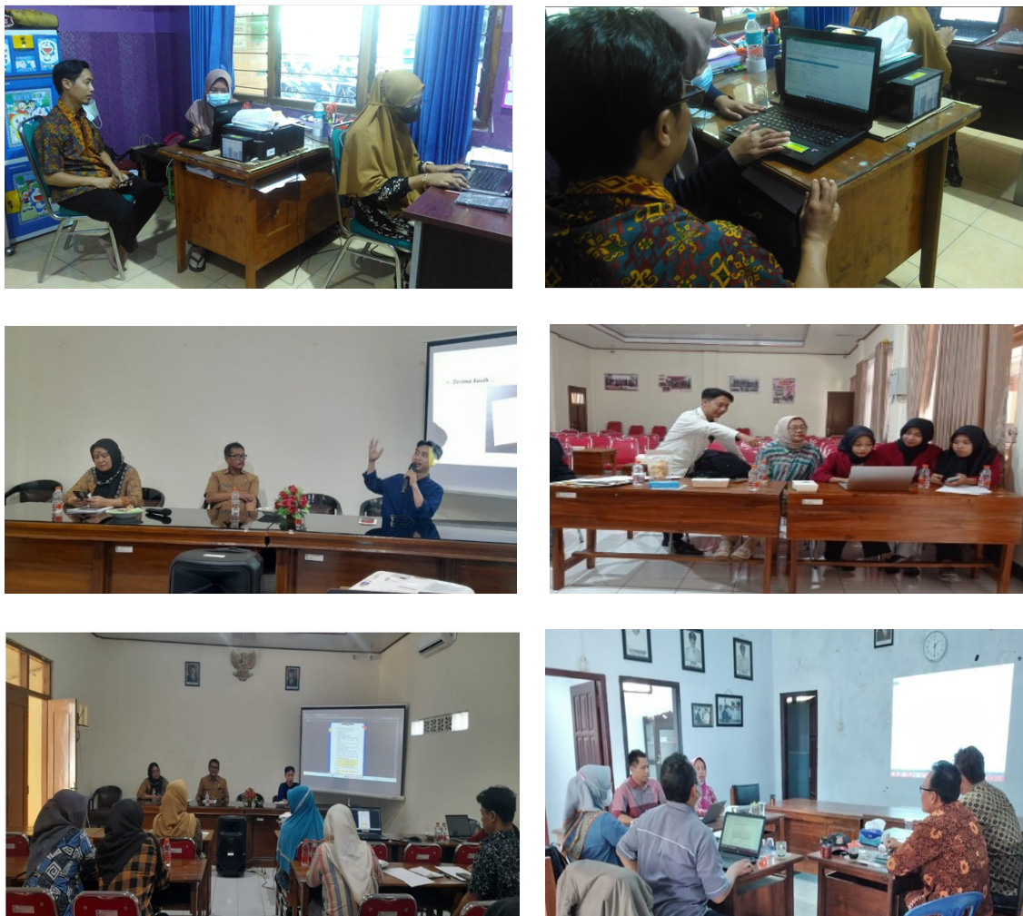
Gambar 2. Pelaksanaan Pembimbingan

Kegiatan dilakukan mulai bulan Mei sampai dengan Juli 2024, dengan memberikan materi dasar tentang akuntansi dan proses dalam pembuatan laporan keuangan secara sederhana bagi UMKM melalui aplikasi MsExcels.