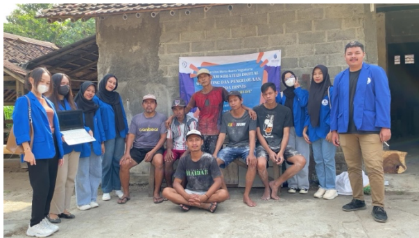
Gambar 3: Sosialisasi Digital Marketing Instagram Mie Lethek Asli Bendo Cap Garuda

Pendampingan dalam pengelolaan SDM berfokus pada peningkatan kapasitas karyawan dalam mengelola pemasaran digital. Kami melibatkan karyawan dalam setiap tahap pembuatan konten dan pengelolaan akun media sosial, sehingga mereka dapat menguasai keterampilan baru yang relevan dengan era digital. Selain itu, keterlibatan aktif karyawan dalam program ini mendorong mereka untuk berpikir kreatif dan inovatif dalam mengembangkan konten yang menarik dan relevan untuk menarik para konsumen.