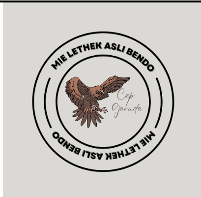
Gambar 1: Hasil Rebranding Logo Mie Lethek Asli Bendo Cap Garuda Asli Bendo