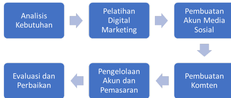
Bagan 1: Metode Pengabdian

akun instagram, pembuatan bio instagram yang menarik serta menyertakan link yang berisi link platform aplikasi pemasaran seperti WhatsApp, Shopee, Tokopedia maupun lainnya yang dapat digunakan dalam pemasaran untuk dapat menjangkau khalayak luas. Disisi lain kami juga mendampingi para karyawan untuk kreatif dalam pembuatan konten, bahkan proses pengeditan video yang menarik, seperti para karyawan membuat video proses pembuatan Mie letek dari awal sampai akhir sebagai strategi promosi.