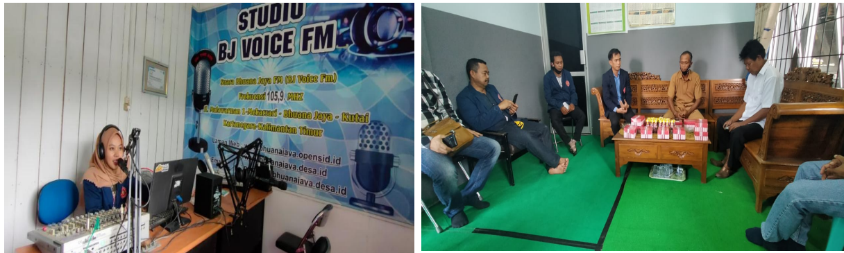
Gambar Pemateri dan Peserta Kegiatan Pengabdian Masyarakat